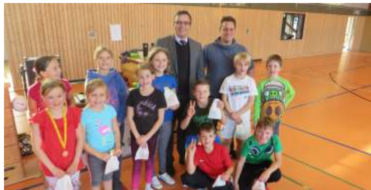
Weitere Bilder auf www.hardegger-stadtgefluester.de