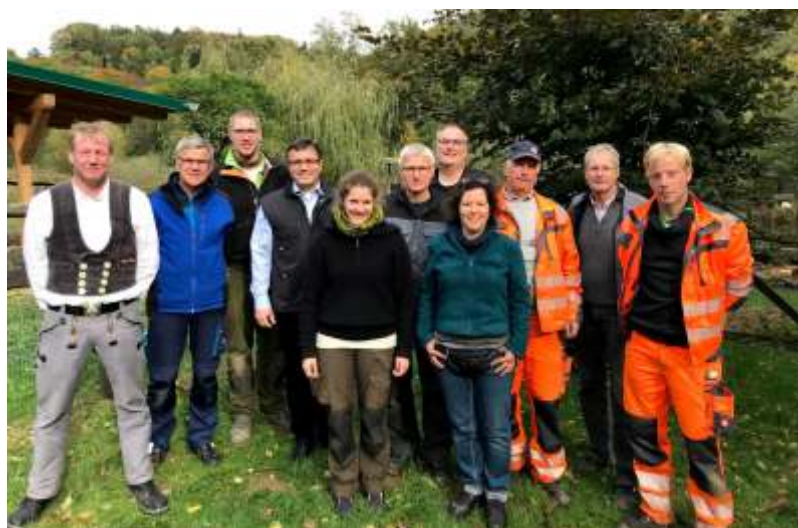
Weitere Bilder auf www.hardegser-stadtgefluester.de

Für das leibliche Wohl mit belegten Brötchen zur Frühstückspause und Grillspezialitäten am Nachmittag sowie Getränken war gesorgt. In heiterer Stimmung hatten alle Helfer*innen viel Spaß bei der Arbeit und können auf die erbrachten Leistungen stolz sein. Nochmal einen ganz herzlichen Dank für die tatkräftige Unterstützung an Alle!