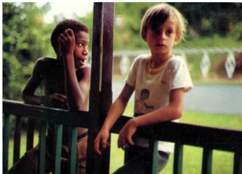
Zwei Bewohner im heutigen Seaford Town

Dort war 1830 die Sklaverei aufgehoben worden und der britische Gouverneur hatte die Befürchtung, dass die wenigen weißen sich in Mitten der farbigen Bevölkerung nicht behaupten könnten.