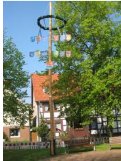
Maibaum auf dem Thie

Allen Helfern ein herzliches Dankeschön für die geleistete Arbeit. Den Überschuss der Feier wird der TSV für erforderliche Arbeiten am Sporthaus nutzen.