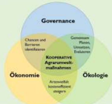
KOOPERATIV-Ansatz: Ökologie, Ökonomie und Governance kooperativer Agrarumweltmaßnahmen wirken im Projekt eng zusammen.