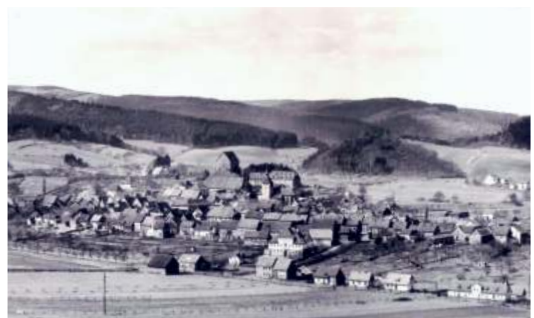
Blick auf Hardeggen vom Gladeberg im Jahr 1930