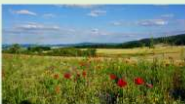
Blühstreifen als Agrarumweltmaßnahme