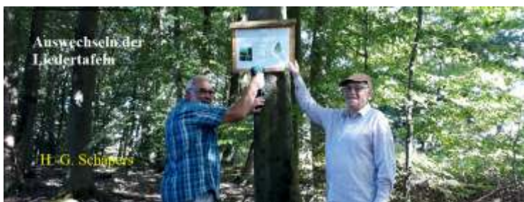
Auswechseln der Liedertafeln