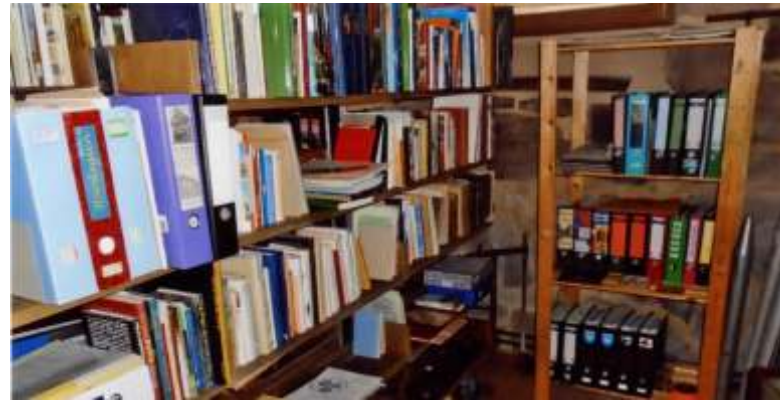
Bibliothek im Burgstall