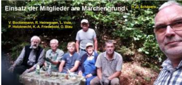
Einsatz der Mitglieder am Märchengrund