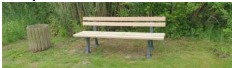
Überholte Bank, Bramburgstraße hinter dem Ortsschild