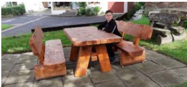
An der Schwülme

An der Schwülme unterhalb der Kirche und an der Bramburgstraße vor dem Friedhof,