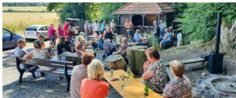
Bei strahlendem Sonnenschein konnten wir vor der Grillhütte im Freien sitzen.