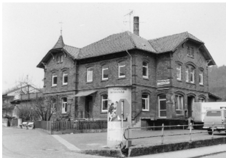
Alte Molkerei Hardegsen

Übrigens: Sie müssen keine Sorge haben, dass Ihre Fotos weg sind, wenn Sie mit uns zusammenarbeiten! Wir scannen Ihre Bilder lediglich ein und geben dann alle Originale an Sie zurück.