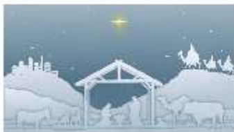
Wir freuen uns auf Euer Kommen!

Auf was freut ihr Euch im Advent und an Weihnachten? Wie zeigt ihr eure Freude? Was ist ein Freudensprung? Und was ist eigentlich das besondere an Weihnachten? Diese Fragen wollen wir gemeinsam mit Euch beantworten.