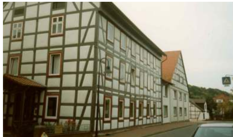
In diesem 1840 erbauten Haus befand sich bis zum Jahre 1884 die Hardegger Brauerei