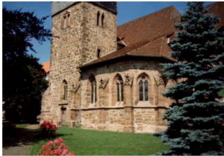
Die St. Georgskapelle