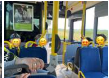
Unterwegs im Linienbus