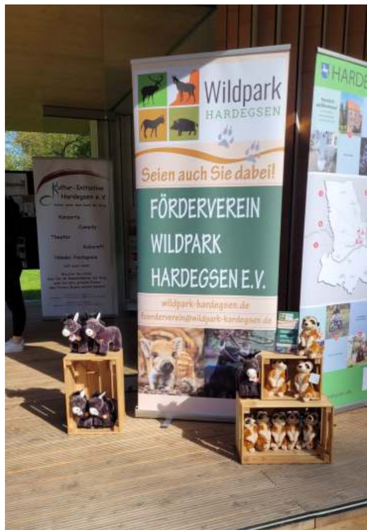
Präsentation des Fördervereins auf der Landesgartenschau