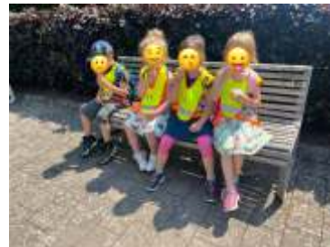
Eis essen im Bürgerpark