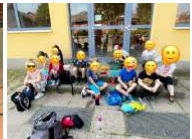
Große Pause in der Schule