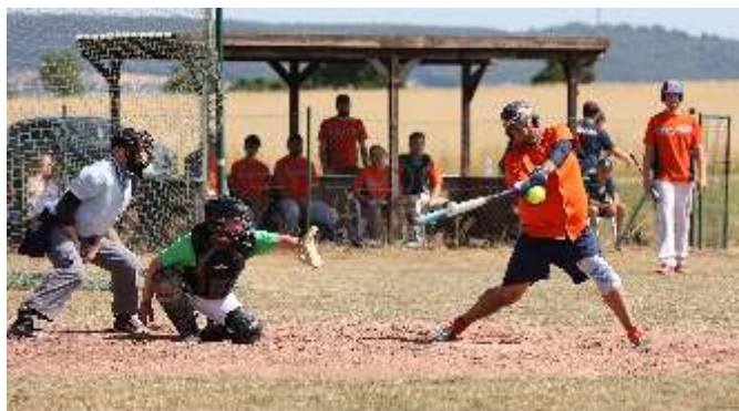
Spislszene aus dem Finale 2022: Die Soest Tita-Nics gewannen gegen Paderborn

Vom 14. - 16. Juli findet im Karl Hartje Ballpark das 31. Sommerturnier der Hevensen Pioneers statt. In diesem Jahr sind acht Mixed Softballteams, u. a. aus Dresden, Frankfurt und Paderborn dabei. Als Cup Verteidiger treten die Soest Tita-Nics an, die im letzten Jahr Paderborn im Finale besiegten.