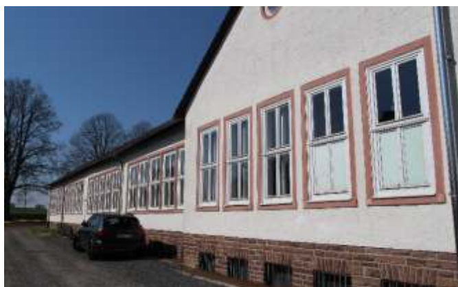
Ostseite des Gebäudes vorher

Kommen Sie zum 3. Leinweberfest am Samstag, 18. Juni 2022 (s. Plakat auf der Titelseite sowie Seite 26) und schauen Sie sich die tolle Bühne an und vor allen Dingen – genießen Sie die Musik. Der Eintritt ist frei!