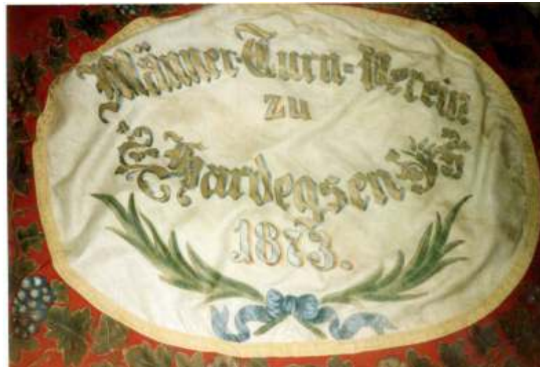
Im Jahr 1873 wurde die heute noch vorhandene Vereinsfahne angeschafft.

bleiben bis 1918. Neben dem Schriftwart wird dann auch ein Kassenwart gewählt, so daß der Vorstand aus 6 Personen besteht. Der Turnbetrieb wurde mit zwei Riegen zu je neun Turnern aufgenommen. Der Verein tritt dem Turnbezirk Oberweser bei, nimmt an Veranstaltungen anderer Vereine teil und führt 1874 in Hardegsen das erste Sportfest durch. Junge Damen zur Überreichung der Siegerkränze werden bei der Generalversammlung gewählt! Jeder Turner muß innerhalb von vier Wochen nach seiner Aufnahme eine Turnkleidung anschaffen. Das Tragen dieser Kleidung ist außerhalb der Vereinsveranstaltungen bei Strafe verboten.