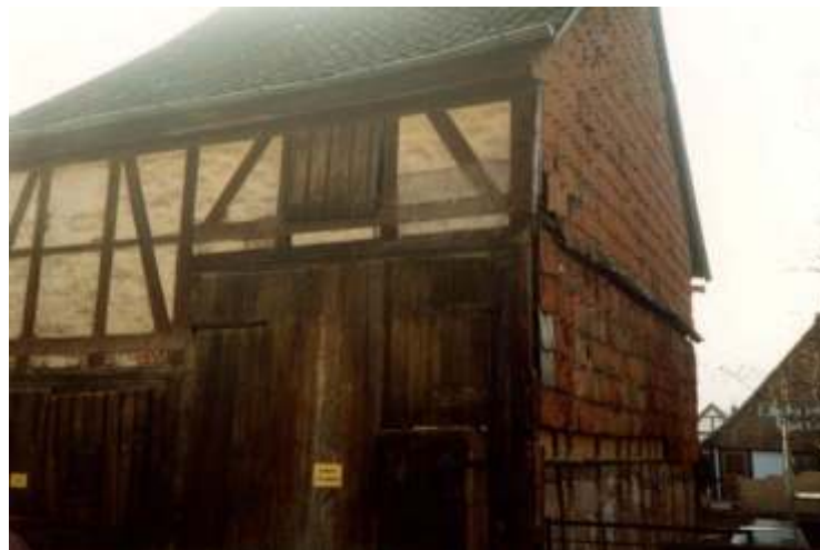
In dieser Scheune in der Hohenstraße die früher zum Gasthaus Schaper gehörte, wurden die ersten Turnübungen des MTV Hardeggen durchgeführt.