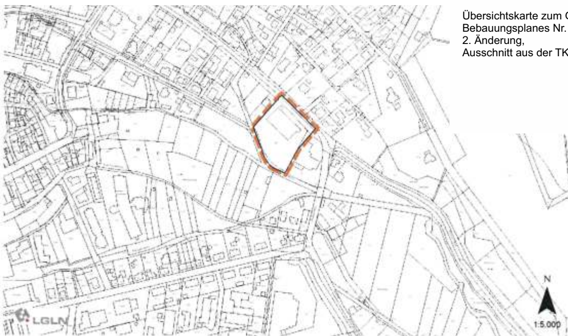
Übersichtskarte zum Geltungsbereich des Bebauungsplanes Nr. 23 „Göttinger Straße“, 2. Änderung, Ausschnitt aus der TK 5, Quelle: LGLN