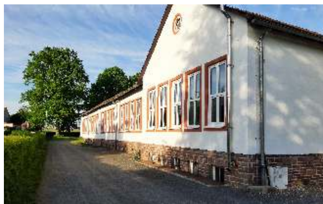
Ostseite des Gebäudes nachher