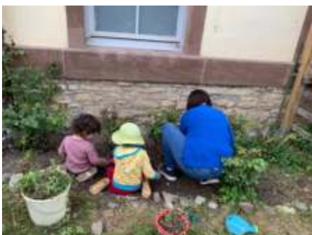
Fleißige Helfer im Beet