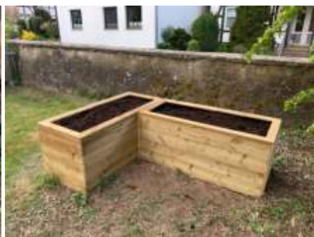
Die fertigen Hochbeete