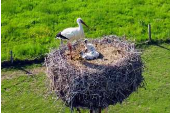
Das Bild zeigt die drei verbliebenen Jungstörche Anfang Mai im Wolbrechtshäuser Storchennest. Gut von der Dorfstraße (Storchensblick) aus zu beobachten.

Nachwuchs bei den Störchen in Wolbrechtshausen. Nach dreißigtägiger Brutzeit sind genau zu Ostern die Jungstörche im Wolbrechtshäuser Storchennest geschlüpft. Zehn Tage später konnte man die ersten Köpfchen aus dem Nest herausragen sehen. Anfänglich waren es vier Jungstörche. Leider hat das jüngste Storchenjunge nicht überlebt. Anfang Mai lag es tot unter dem Nest.