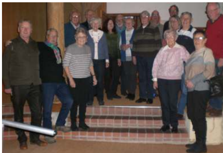
Zum Klönnachmittag hatte sich eine große Gruppe gefunden