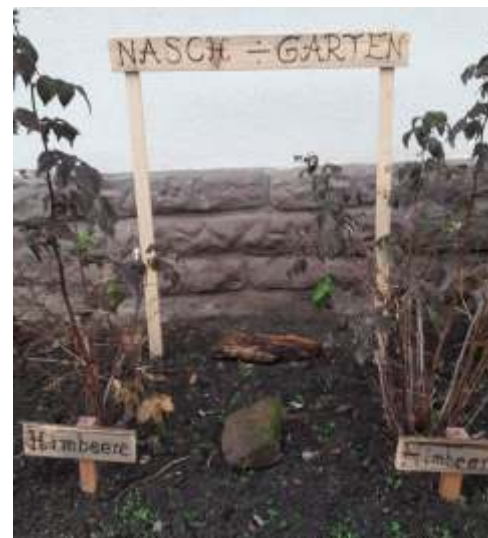
Der Naschgarten wartet auf den Frühling