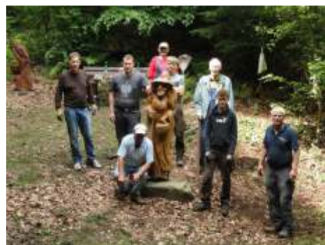
2021: Acht Vereins-Aktive, „ihre“ Hexe und der Eulenbaum (links oben)