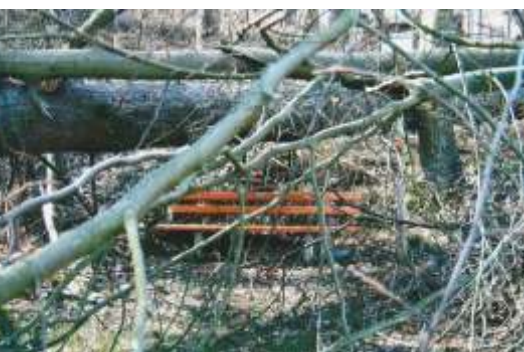
Die Folgen von Sturmtief „Kyrill“ 2008