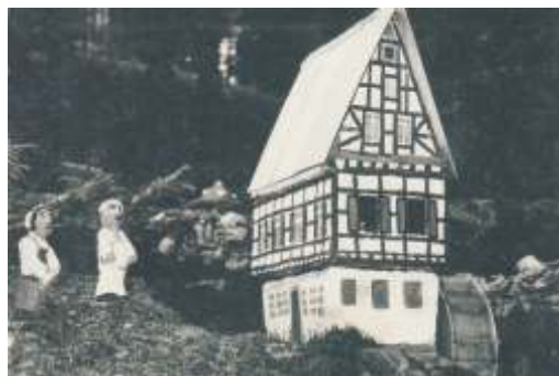
Die alte Mühle mit den Müllern und dem Wasserrad