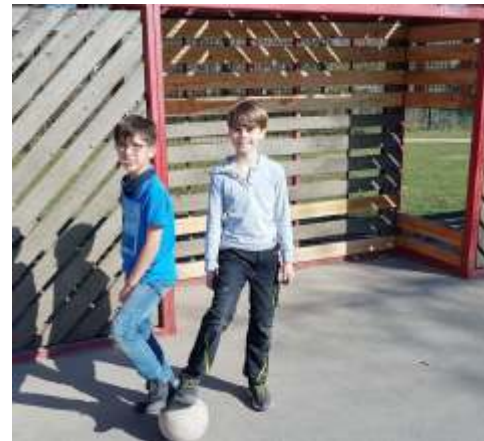
Die ersten Kinder auf dem Bolzer