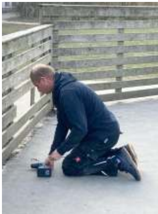
Väter bei der Arbeit