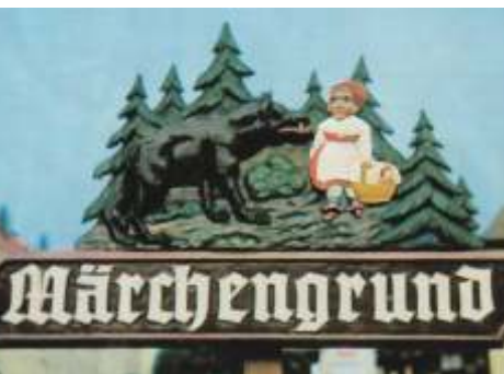
Der alte Wegweiser zum Märchengrund

Davon kann nach dem Wiederbeginn keine Rede sein, denn alle Holzfiguren stammen aus heimischen Wäldern und sind entweder naturbelassen oder haben eine Schutzschicht aus unbedenklichem Material. Mit vereinten Kräften wurden die Figuren auf Sandsteinsockel gesetzt und an der Karlsquelle aufgestellt. Unter der neuen Vereinsvorsitzenden, Sabine Fischer, wurde der Märchengrund um weitere Figuren vergrößert und eine kleine Brücke über den Karlsbach gebaut. Alle „Bewohner“ des Märchengrundes warten jetzt auf kleine und große Besucher.