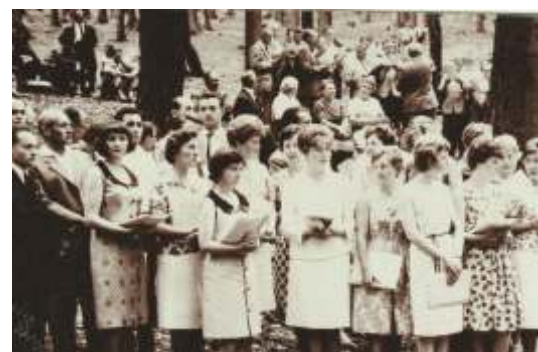
Die Mitglieder des Singkreises bei der Einweihungsfeier

Weitere Fotos finden Sie im Schaukasten des HSV an der Langen Straße 15