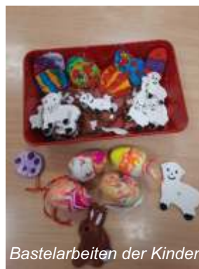
Bastelarbeiten der Kinder