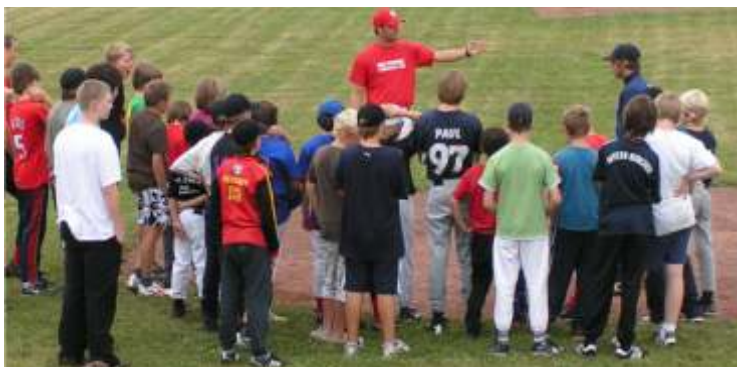
Wir freuen uns auf viele Kinder und Jugendliche und jung gebliebene, die sich für unseren Sport interessieren

Schnelligkeit ausgleichen können. Deshalb haben grundsätzlich alle die Möglichkeit Baseball, ihren individuellen Stärken entsprechend und auf geeigneten Teampositionen, zu spielen. Eltern bietet die Betätigung ihrer Kinder in einer Mannschaftssportart Unterstützung bei einer persönlichkeitsbildenden Freizeitgestaltung und Förderung. Für nähere Auskünfte stehen allen Interessenten Steffi Schneider (Telefon 05503 804904) und Annett Naumann (Telefon 05503 805880) zur Verfügung. Für die Teilnahme am Training braucht man lediglich strapazierfähige Sportkleidung und Sportschuhe. Natürlich sind auch ältere Jugendliche und Erwachsene herzlich bei den Pioneers Willkommen. Denn auch im Seniorenbereich möchte man ein neues Team formieren. Die Termine findet man zeitnah auf der Internetseite der Pioneers unter www.hevensen-pioneers.de oder face-book.com/HevensenPioneers