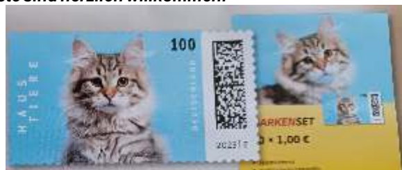
Text / Foto: H. Hoppe und DP