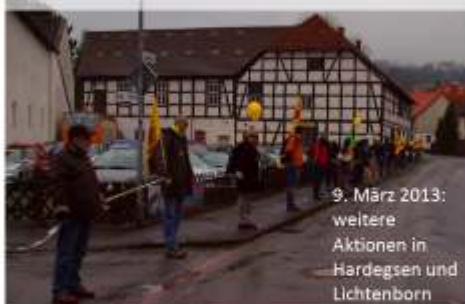
9. März 2013: weitere Aktionen in Hardeggen und Lichtenborn

Der Umweltbeirat koordiniert bei der Umzingelung des AKW Grohnde die Aktion in Gladebeck