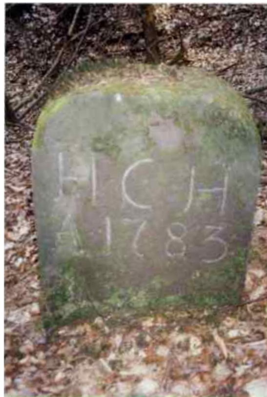
HCH = Hardegger Cämmerey-Holtz Standort am Bollert