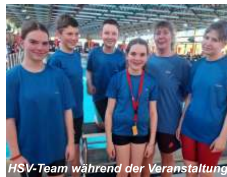
HSV-Team während der Veranstaltung

Trainingszeiten in Turnhalle Hardeggen „Am Gladeberg“ für Jugendliche: donnerstags von 17.15 - 18.30 Uhr