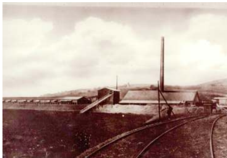
Das Kalkwerk Hardeggen an der Bahnstrecke Northeim - Ottbergen 1898