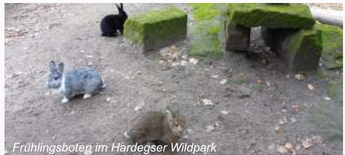
Frühlingsboten im Hardegger Wildpark