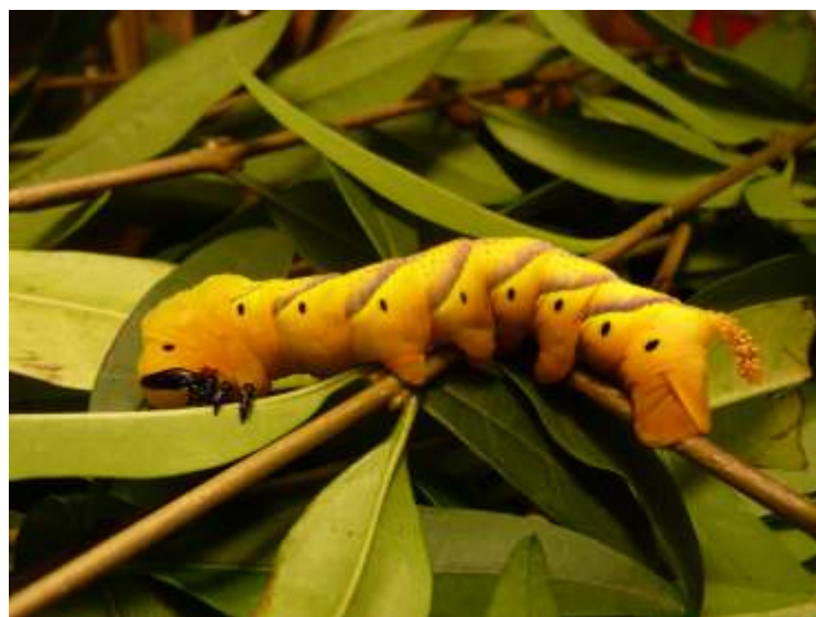
Auf dem Foto ist die Raupe eines Totenkopfschwärmers zu sehen, die gerade im Institut als Puppe liegt und demnächst als Schmetterling schlüpfen wird.

Weitere Informationen unter: www.oeko-institut-hardeggen.de , oder bei Josefine Grüger unter 017661515188