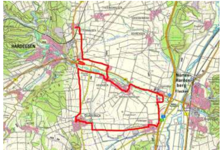
Entwurf der Route