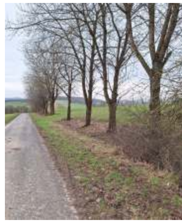
Gesamtansicht mit Auffahrt

Es ist geplant, dass in einer der nächsten Sitzungen des Umwelta noch näher über das Thema Rückschnitte informiert werden soll.