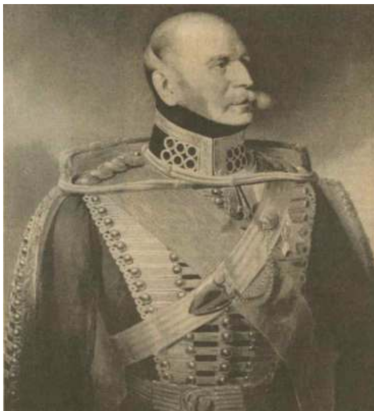
König Ernst August. Nach einem zeitgenössischen Portrait