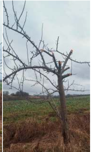
Baumschnitt Willkür Krone