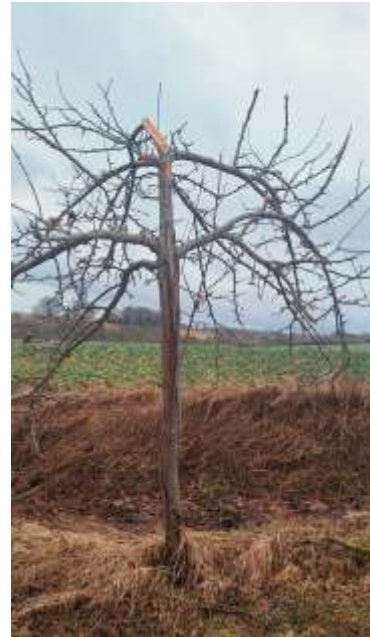
Baumschnitt Willkür geköpft