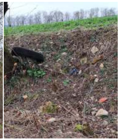
Asche, ohne Hecke mit Müll