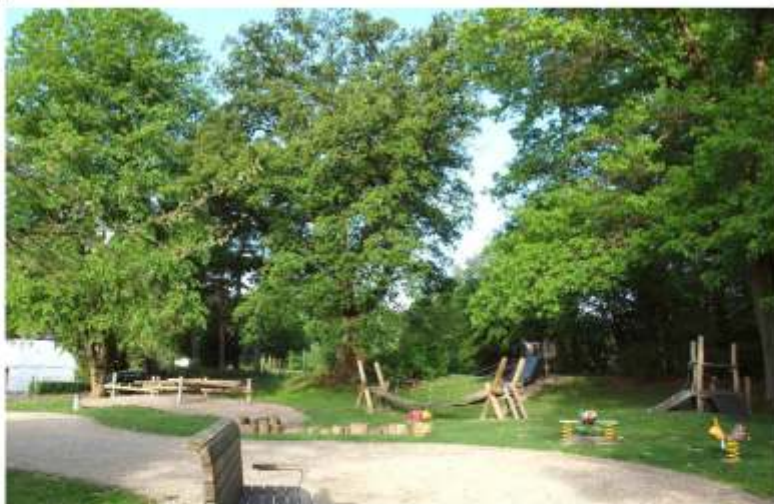
Mehrgenerationenplatz „Am Büh“

... und wenn es allmählich kühler und feuchter wird, begeben wir uns langsam nach Hause und träumen hoffentlich etwas Schönes – auch wenn wir uns am nächsten Morgen nicht mehr daran erinnern können.