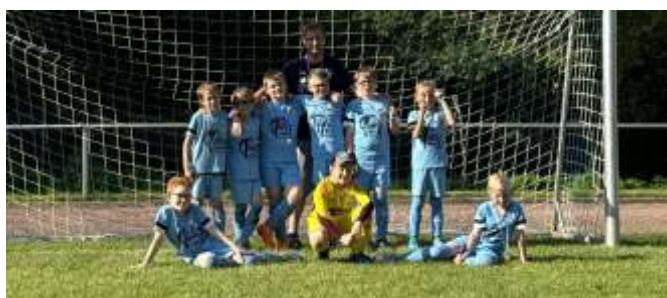
Es spielten für Team „blau“: