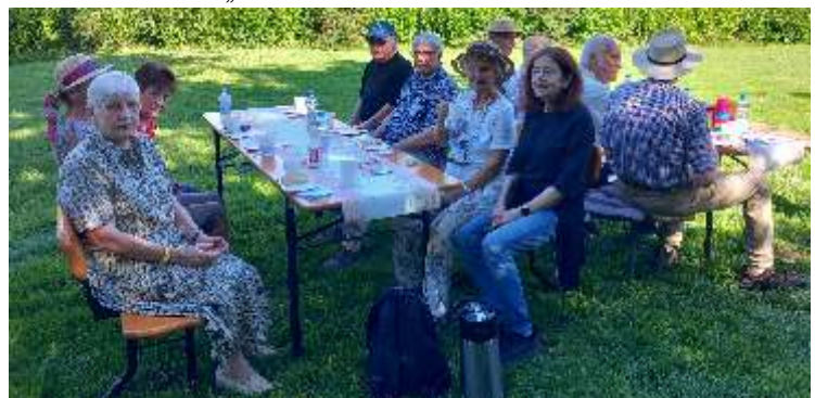
Gemeinsame Runde beim Abschluss der Wanderung