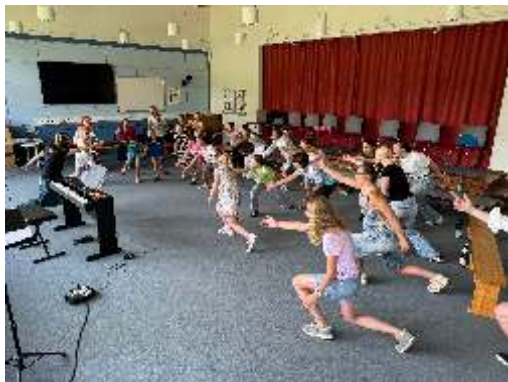
Cantus Cordis Hardegsen

Die Bilder zeigen einen Teil der Gruppe vor dem Muthausfilm und in den Proben