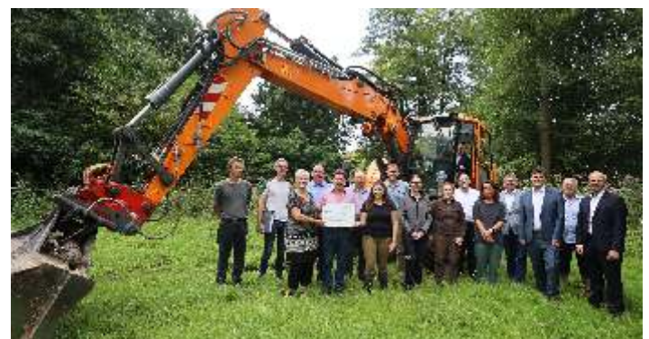
Das Foto zeigt: Ratsmitglieder, Förderer, Bürgermeister, Bauamtsleiterin auf dem Bagger und das Wildpark-Team

Erfreulicherweise konnte der Antrag im Januar 2023 gestellt werden. Der Bewilligungsbescheid wurde am 27.06.2023 mit einer Fördersumme von 317.564,72 € erteilt. Allerdings ist im Hinblick auf die umfangreiche Baumaßnahme und deren Ausführungszeit, vorangegangener öffentlicher Ausschreibung durch die Zentrale Vergabestelle des Landkreises Northeim (Zeitfaktor 3 Monate) und der dann eintretenden Witterung die Maßnahme im bewilligten Zeitraum durch das fortgeschrittene Jahr nicht bis zum 01.03.2024 umsetzbar. Eine Fristverlängerung des Bewilligungszeitraumes bis zum 01.03.2025 wurde bereits zugestimmt.