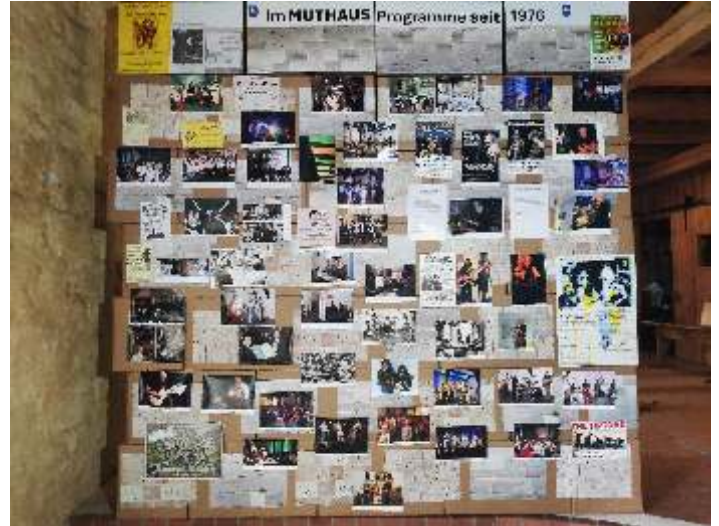
Ausstellungseingang: 48 Jahre Veranstaltungen und Kulturangebote im Muthaus

Eröffnung: 31.8. um 11 Uhr im Versammlungsraum des Kuhstalles. Danach ist die Ausstellung am Samstag bis 18 Uhr und am Sonntag 1.9. von 11- 18 Uhr geöffnet.