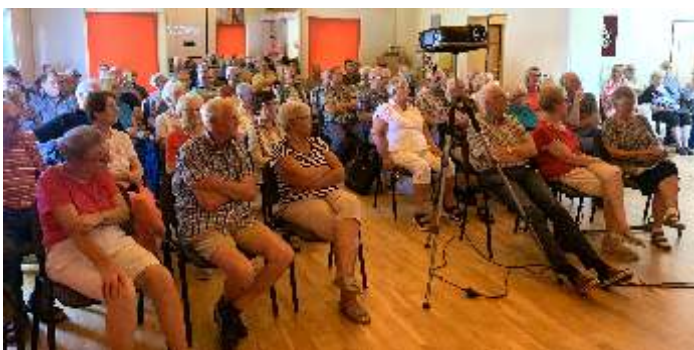
Der gut gefüllte Gymnastikraum im Hardegser Sportheim