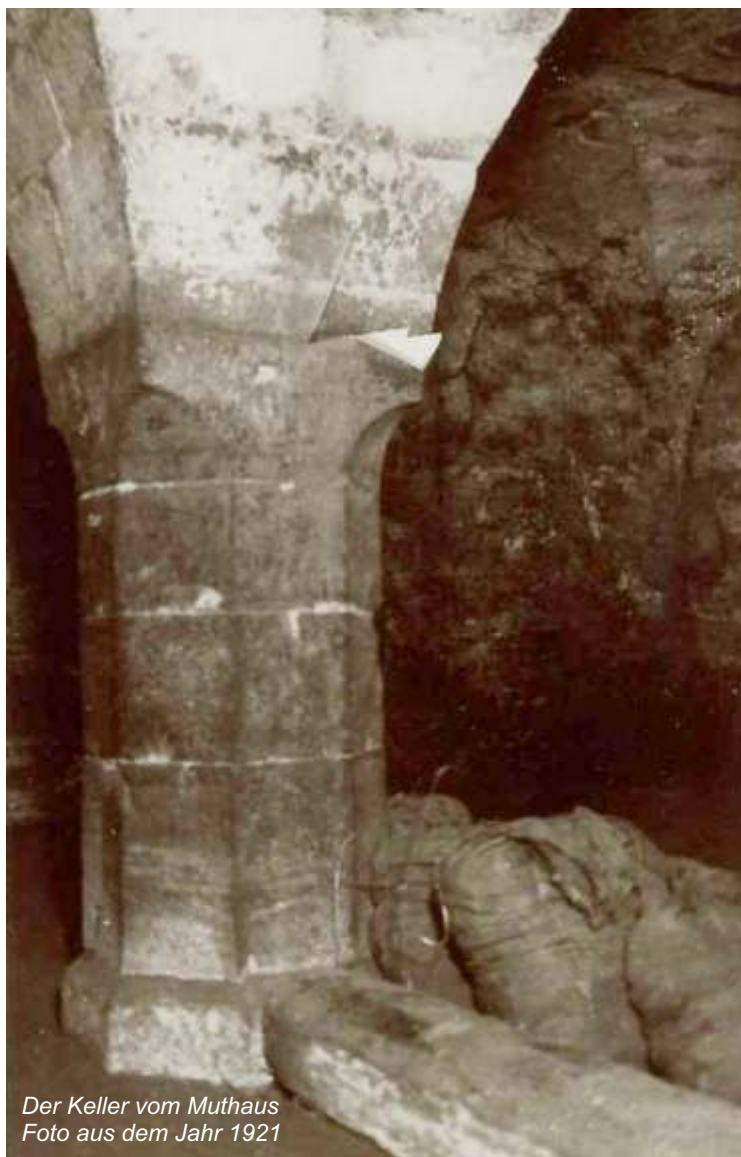
Der Keller vom Muthaus Foto aus dem Jahr 1921

dieser Sache eine Tagung der Sächsischen Städte in Goslar einzuberufen. Da die Einbecker fast keine Verteidiger mehr zur Verfügung hatten, befürchteten sie einen direkten Angriff auf ihre Stadt. Da sie auch Mitglied der Hanse war, forderte sie diese Organisation am 12 Juni 1479 auf, ihren vertraglichen Pflichten nachzukommen und Truppen zur Verteidigung der Stadt Einbeck zu schicken.