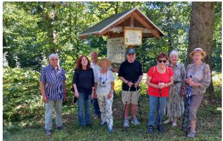
Vor der Liedertafel „Waldeslust“