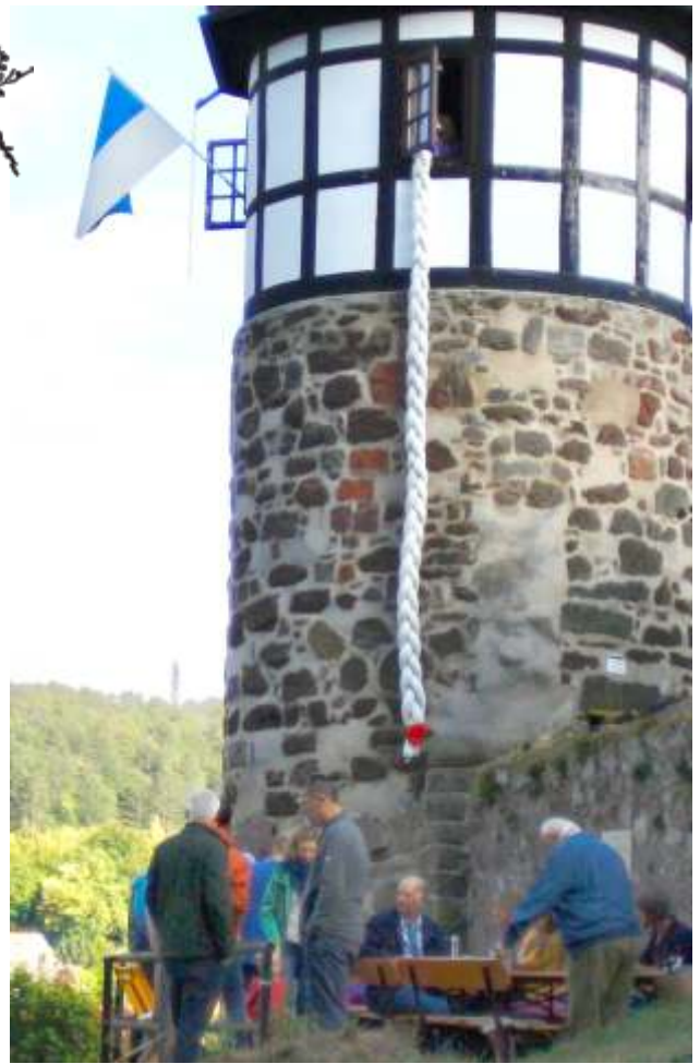
Tag des offenen Denkmals 2023: Wachturm mit Rapunzel-Zopf